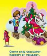
Соседи силу удержают, Кресту ей придают, Но пожаром удержат И беду Вам принесут!