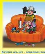
Волнует лить кот — согревать газует — По всекому случается, Но что когда зажигалку возьмет Никто не совещается!