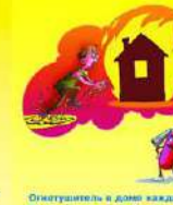
Огнетушитель в доме каждому — То не пригудо и не блажь, А спасается дом однажды, Поможет он чего угодно!