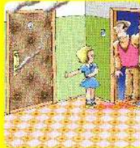
Обратись к соседям, позови на помощь