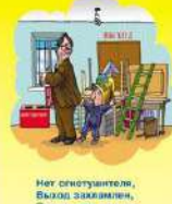
Нет ситуанттеле, Быстро замкнитесь, Смечит при пожаре Мы здесь не пройдем!