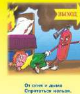
От огня и дыма Спрячьтесь низенько, Убегать из дома Нужно вам, друзья!