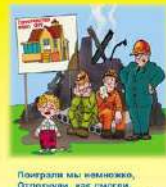
Поиграли мы немножко, Отдыхали, как смогли, Слышим, что повелел Сержант, Новый дом дотряхивать!