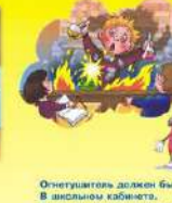
Огнетушитель должен быть В анисном кабинете, Огню не поддавайся никогда, Смелойки будут дети!