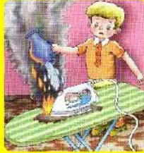
Нельзя заливать водой электроприборы