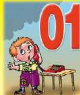
Пусть знает каждый гражданин Пожарный номер — «01»!