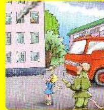
Если кто-то остался в квартире (помещении), сообщи об этом пожарным