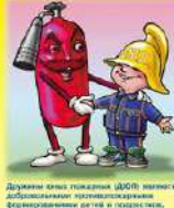
Дружны они пожарные ДЮП: помогают добросовестно противопожарными оборудованиями детей и взрослых, играми знакомят с правилами поведения у себя дома (пожарная лестница, телевизионная антенна, мушкетер, книгочеловек и другие игрушки).