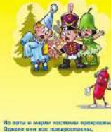
Из воды и мажи костюмы выкроили, Обдели они нас парадными, Но если огнем костюм прижжет, То в нем можно сваяло под вилкой вилку!