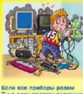
Если все приборы разом Ты в одну розетку влючишь, То пожар проводов сразу В этой комнате получишь!