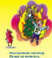
Наисправную гирлянду Лучше не включать, Чтоб искоры не брызнул В дом не выскочить!