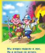
Мы вчера ждали в лес, Ну а искры из искры, Так от нашего костра Целый лес огорел дотла!