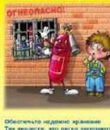
Обеспечьте надежное хранение Тех веществ, что легко загорятся, Определены для них емкости — Так пожары предотвратятся!