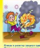
Огнем в розетку засунул один — Искры и пламя — до потолка, То, что ты видишь живое, Пожалуй тебе, — герой!