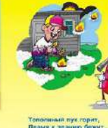
Топольный пух горит, Пламя к зданию бежит... Потрясает наш малыш, А дома стоят без крыш!