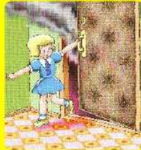
Немедленно уходи из квартиры (помещения), закрой за собой дверь