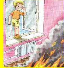
Нельзя открывать окна