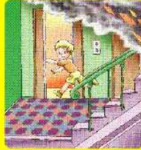
Нельзя пользоваться лифтом