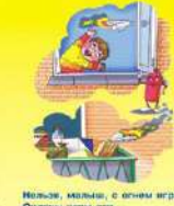
Нельзя, малыш, с огнем играть — Опасны игры эти. Ведь могут люди пострадать! И взрослые, и дети.