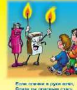
Если спички в руки взял, Огню ты опасения ставь — Воды огню, что в пак живет, Много бед всем принесет!