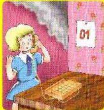
Позови по телефону 01 и вызови пожарных